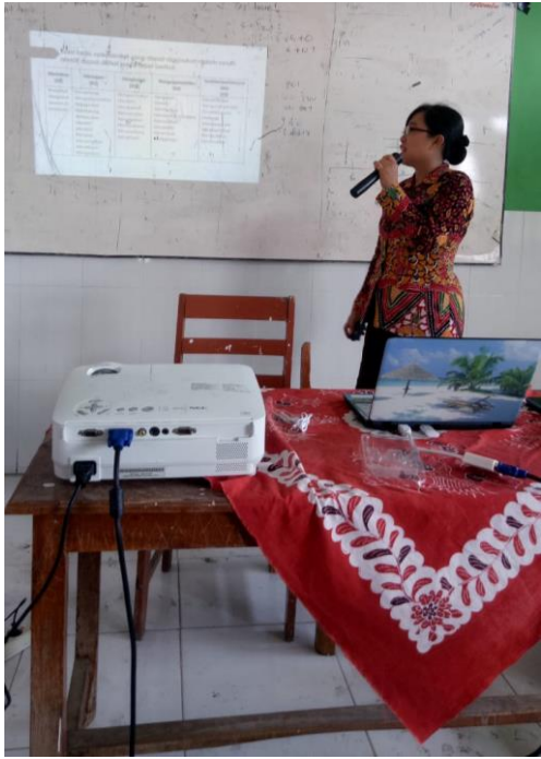
Foto 4 Observasi Penyusunan RPP