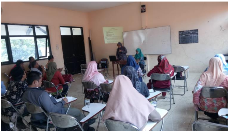
Foto 2 Observasi Bedah Materi IPS