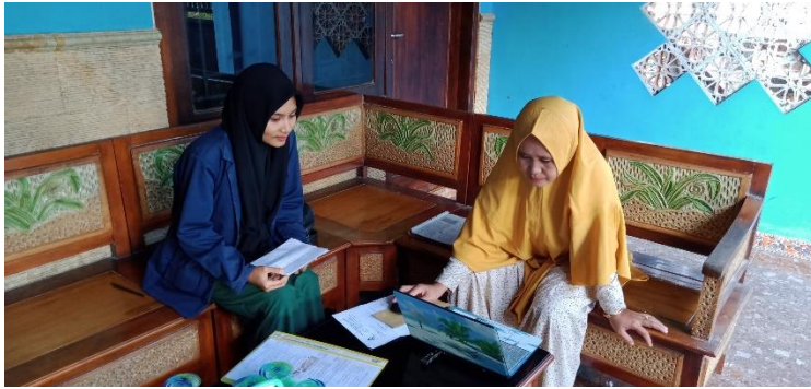
Foto 1 Observasi Penyusunan RPP