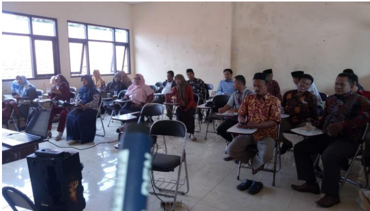
Foto Bedah Materi IPS