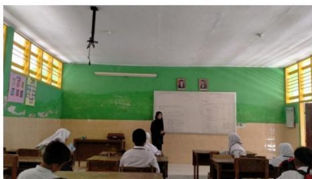
Siswa memperhatikan penjelasan guru