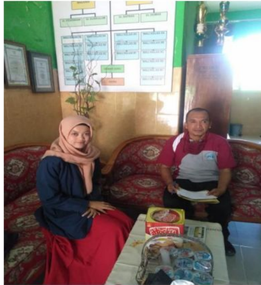
Foto bersama Kepala Sekolah SMPN 1 Tlanakan setelah mengajukan permohonan penelitian