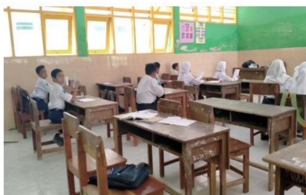
Siswa mengerjakan soal pre test