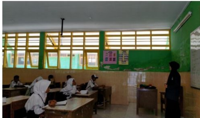
Siswa memperhatikan penjelasan guru