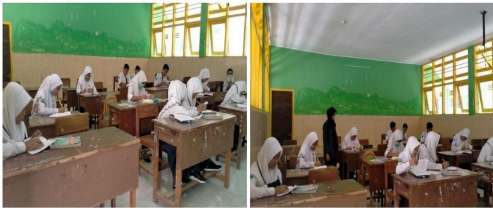
Siswa mengerjakan soal post test