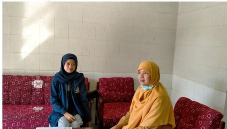
Dokumentasi bersama guru mata pelajaran IPS