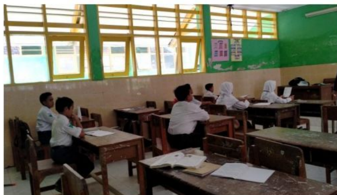
Siswa mengerjakan soal post tes