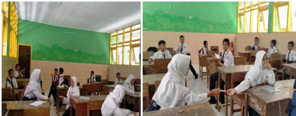
Metode talking stick (tongkat bergulir dari satu siswa ke siswa yang lain)