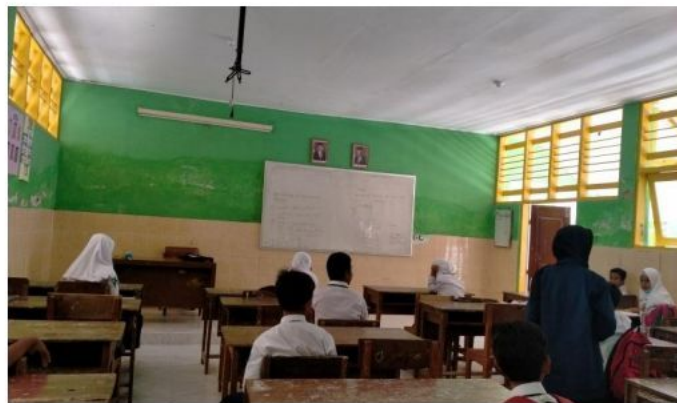
Siswa mengerjakan soal pre test