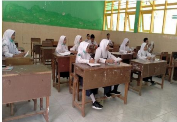
Siswa memperhatikan penjelasan guru