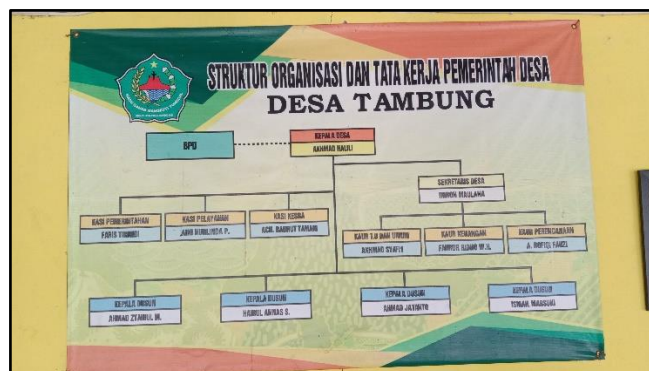
Gambar 4. 1 Struktur Pemerintah Desa

Masyarakat desa Tambung sudah sadar pendidikan dan kesehatan yang dibuktikan adanya Sarana pendidikan dan Kesehatan yang memadai. Dari sisi pendidikan, di desa Tambung terdapat beberapa yayasan dan lembaga pendidikan. Sedangkan dari sisi kesehatan, desa Tambung sudah mempunyai tempat (posko) yang digunakan dalam membantu melayani masyarakat yaitu POSKESDES yang bertempat di dusun Niggara. Desa Tambung juga mempunyai Gedung Olahraga (GOR).