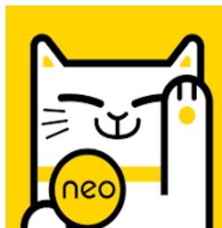
Gambar 2. Logo Neobank

Aplikasi Neobank ini masih baru dibandingkan dengan aplikasi yang serupa dengannya di Google Play Store dan App Store , namun penggunaannya sudah cukup banyak. Saat ini aplikasi Neobank telah terunduh lebih instalan. Aplikasi Neobank hadir dengan inovasi dan juga konsep yang baru. 3 Untuk mendaftar di aplikasi ini cukup mudah, hanya dengan menggunakan nomor handpone atau menggunakan akun e-mail yang aktif berikut adalah logo Neobank .