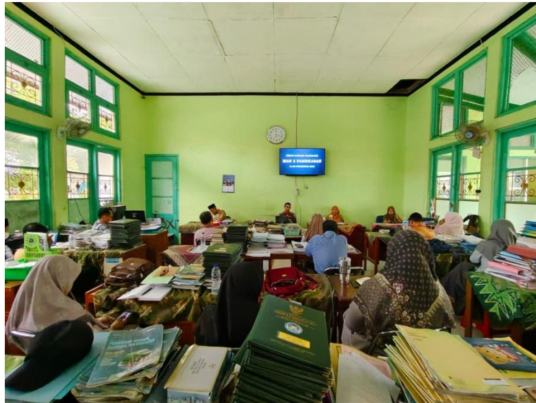
Gambar 1.5 Foto dokumentasi kegiatan bimbingan dan evaluasi dari kepala perpustakaan dan kepala sekolah MAN 2 Pamekasan 23

Hal tersebut diperkuat dengan adanya foto dokumentasi yang peneliti minta ketika melakukan observasi langsung di MAN 2 Pamekasan, seperti gambar sebagai berikut: