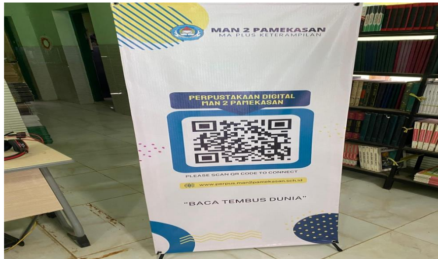
Gambar 1.2 Foto fasilitas layanan referensi secara online di perpustakaan MAN 2 Pamekasan 6

Pada gambar 1.2 dapat diketahui bahwa di perpustakaan Madrasah Aliyah Negeri 2 Pamekasan tersedia layanan referensi online berupa perpustakaan digital, dimana peserta didik bahkan guru dapat mengakses situs perpustakaan online MAN 2 Pamekasan untuk membaca dan mencari bahan referensi kapanpun dan dimanapun.