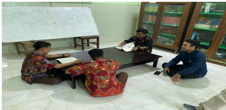
Gambar 1.3 Foto aktifitas membaca siswa di ruang baca perpustakaan MAN 2 Pamekasan 12

Pada gambar 1.3 menunjukkan bahwa siswa dapat memanfaatkan ruang baca yang disediakan oleh perpustakaan Madrasah Aliyah Negeri 2 Pamekasan dengan kondisi ruang baca yang bersih, rapi, kondisi penerangan yang baik dan tidak ramai sehingga siswa dapat membaca buku dengan konsentrasi.