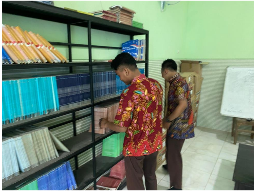
Gambar 1.1 Dokumentasi kegiatan peserta didik melakukan peminjaman buku referensi di perpustakaan MAN 2 Pamekasan 3

Pada gambar 1.1 menunjukkan bahwa terdapat banyak koleksi buku tersedia di perpustakaan Madrasah Aliyah Negeri 2 Pamekasan yang dapat dibaca dan dipinjam oleh peserta didik untuk menunjang kegiatan pembelajaran dan terlihat bahwa ada beberapa siswa yang sedang mencari buku yang kemudian akan dibaca dan dipinjam. Semua koleksi buku dan bahan bacaan lainnya sudah tertata dengan rapi sesuai dengan jenis dan kelompok bukunya. Dengan adanya koleksi buku dan bahan referensi lainnya, peserta didik dapat menikmati layanan peminjaman buku di perpustakaan.