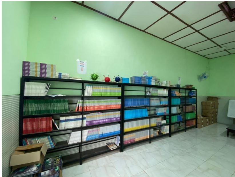
Gambar. Fasilitas perpustakaan berupa koleksi buku dan bahan refrensi lain untuk mengoptimalkan pelayanan perpustakaan 27