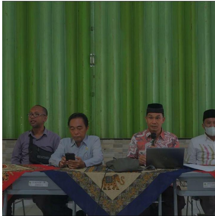
Gambar. Dokumentasi kegiatan work shop yang diikuti oleh kepala sekolah dan tenaga perpustakaan Madrasah Aliyah Negeri 2 Pamekasan. 30

Hasil wawancara tersebut juga diperkuat oleh hasil dokumentasi sebagai berikut: