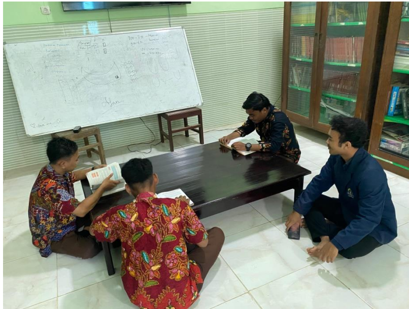
Gambar. Fasilitas ruang baca yang bersih di perpustakaan Madrasah Aliyah Negeri 2 Pamekasan 26

Hasil wawancara dan observasi yang dilakukan oleh peneliti, diperkuat oleh hasil dokumentasi sebagai berikut: