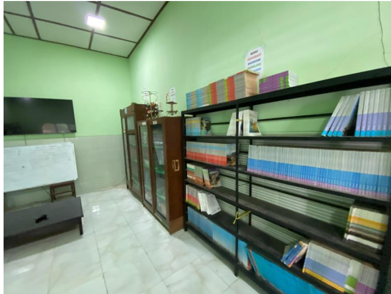
Gambar. Semua koleksi buku dan bahan refrensi sudah dirapikan dan ditata sesuai kelompok buku, kegiatan tersebut dilakukan oleh pustakawan 15