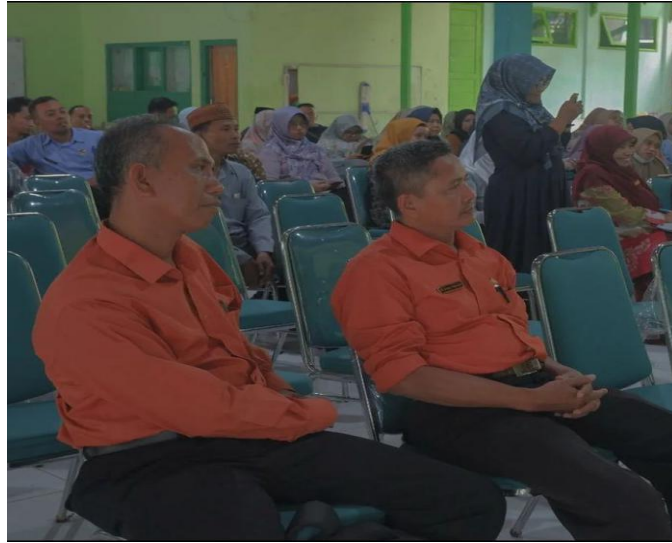
Gambar. Kepala perpustakaan dan pustakawan mengikuti kegiatan pelatihan 22

Hasil observasi dan wawancara juga diperkuat dokumentasi yang diambil oleh peneliti di Madrasah Aliyah Negeri 2 Pamekasan seperti gambar berikut: