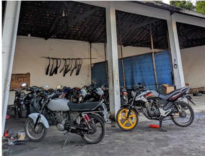
Gambar saudara Fiky saat medatangi bengkel secara langsung Untuk menyewa jasa upgrade mesin

Wawancara berikutnya dilakukan dengan saudara Dodo selaku penyewa yang melakukan upgrade mesin di bengkel Calm Motor Classic, berikut hasil wawancaranya :