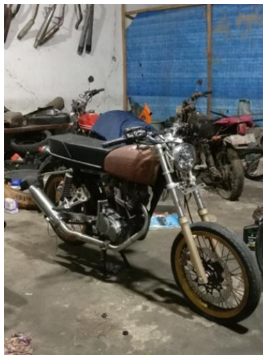
Gambar sepeda motor milik saudara Vito Saat penyerahan manfaat setelah upgrade mesin

Menurut wawancara diatas dikatakan waktu penyerahan tidak sesuai kesepakatan di awal akad dan menurutnya yang menyewakan juga tidak memberi informasi terkait keterlambatan tersebut.