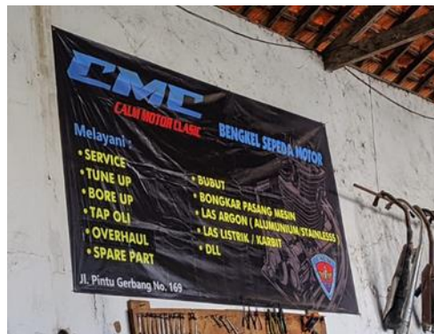
Gambar jasa yang tersedia di bengkel Calm Motor Classic

Berdasarkan pernyataan pemilik bengkel diatas, dapat dikatakan bahwa Penyewa dapat menyewa jasa upgrade mesin kepada pemilik bengkel melalui WhatsApp atau langsung datang ke bengkel namun cara kedua cara tersebut ditanyakan secara detail juga perihal keinginannya. Selain itu pemilik bengkel juga memenuhi pesanan sesuai permintaan para penyewa, karena hal ini memang harus dipenuhi oleh yang menyewakan (pemilik bengkel).