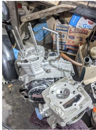
Gambar mesin milik Andre sebelum Dilakukan upgrade mesin di bengkel Calm Motor Classic

pesanannya, saudara Andre langsung datang ke bengkel Calm Motor Classic karena dirasa lokasi bengkel Calm Motor Classic tidak jauh dari rumahnya.