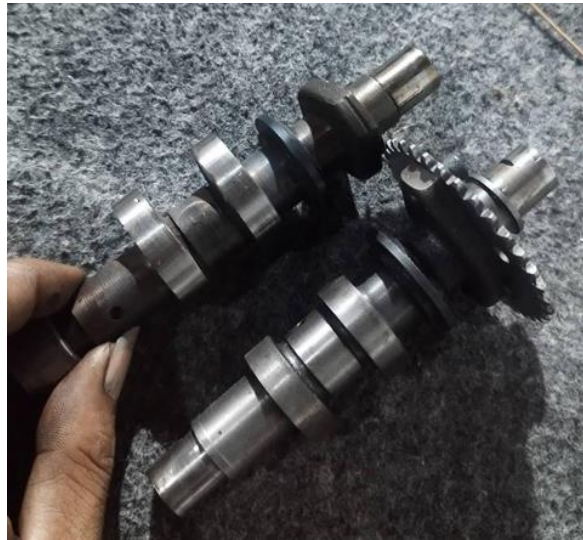
Gambar custom chamshaft milik saudara Dodo Setelah menyewa jasa pemilik bengkel

bisa bersilaturrehmi. Dan diperkuat dengan bukti custom chamshaft yang sudah diambil di bengkel Calm Motor Classic milik saudara Dodo