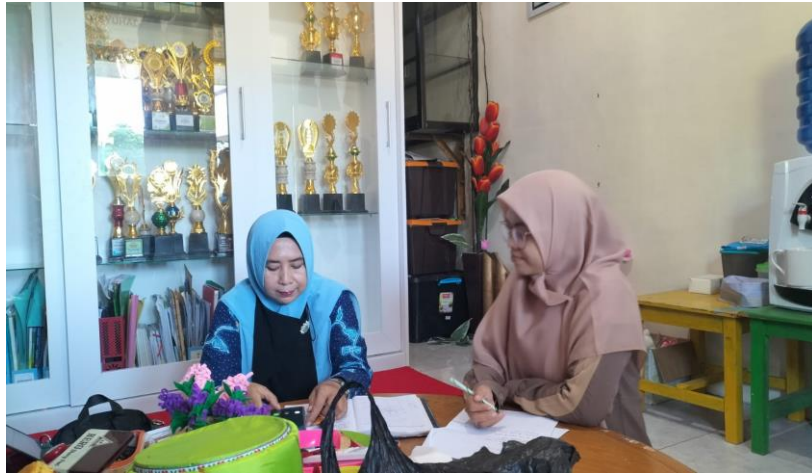
Wawancara peneliti dengan kepala RA Asy-Syuhada'