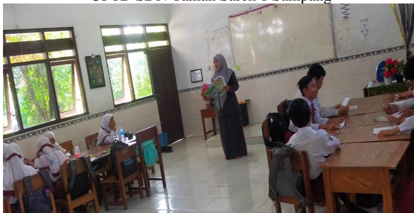
Kegiatan Belajar Mengajar di UPTD SDN Taman Sareh 1 Sampang