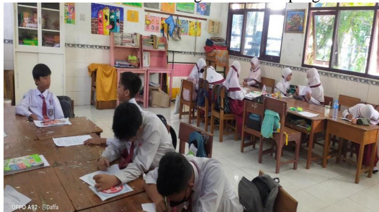
Kegiatan Belajar Mengajar di UPTD SDN Gunung Sekar 1 Sampang