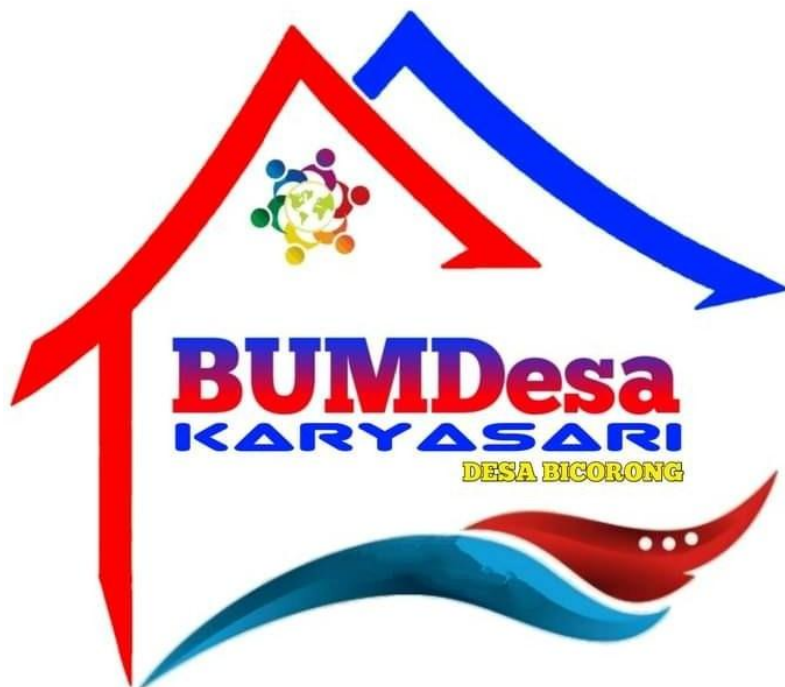
Gambar 4.1 : Logo BUMDes Karyasari Desa Bidorong Kecamatan Pakong

Badan Usaha Milik Desa ‘KARYASARI’ Bidorong dalam melaksanakan program kerja yang telah disusun Pada dasarnya sangat ditentukan oleh konsistensi dan semangat kebersamaan untuk bersinergi dari semua pihak, baik dari pengurus, pemerintah desa, Pemerintah Kecamatan, Pemerintah Kabupaten dan Khususnya