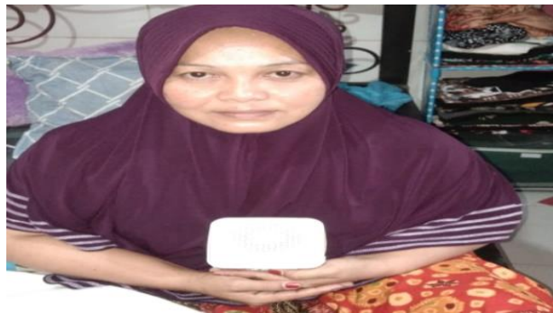
Catatan Kesehatan Ibu Hamil