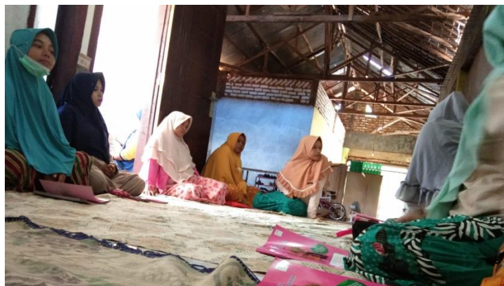
Kelas Ibu Hamil