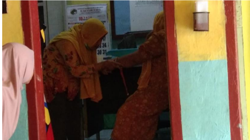
Pemeriksaan Ibu Hamil