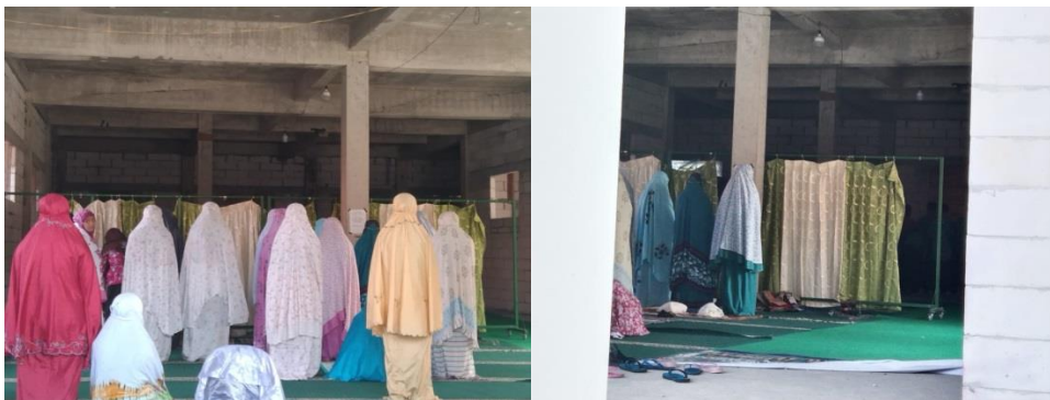
Gambar 4.8 Foto Pelaksanaan Shalat Dzuhur Berjamaah

Berdasarkan hasil observasi dan dokumentasi yang peneliti lakukan, kegiatan shalat dzuhur berjamaah dilakukan setiap hari di jam istirahat. Istirahat dilaksanakan di jam 12:00 – 13.00 setelah itu bel masuk. Biasanya yang menjadi imam shalat adalah guru. Kegiatan shalat berjamaah ini dilakukan secara bergantian karena kondisi masjid sedang dalam perbaikan / renovasi. 43