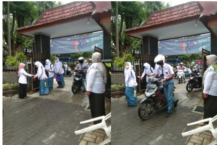
Gambar 4.6 Foto Peserta Didik Terbiasa Tertib dan Disiplin Masuk Sekolah

Banyak kegiatan pembiasaan yang positif yang peneliti lihat selama berada di lokasi penelitian, seperti budaya senyum, salam, sapa, shalat dan mengaji dengan kesadaran sendiri, budaya bersih, tertib, dan disiplin dalam waktu. 31