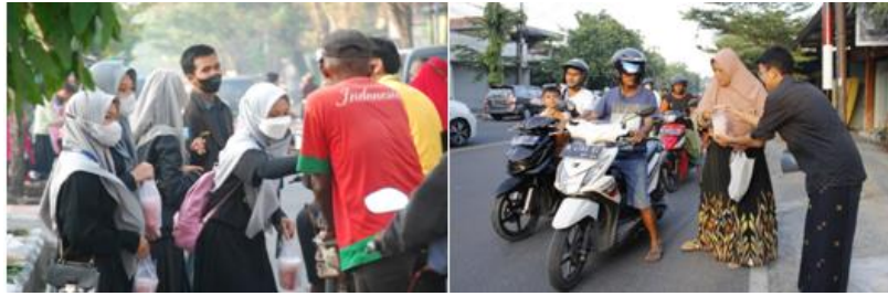
Gambar 4.4 Kegiatan Pembagian Takjil yang Dilakukan oleh OSIS

Strategi-strategi yang senantiasa telah dilakukan dalam pelaksanaan hidden curriculum dalam pembentukan budaya religius peserta didik tersebut di atas diharapkan dan diyakini mampu memberikan hasil yang maksimal dan mampu membentuk peserta didik yang kelak memiliki budaya religius yang sesuai harapan dan cita-cita SMAN 1 Pamekasan. Dengan demikian SMAN 1 Pamekasan sebagai salah satu lembaga pendidikan di Kabupaten Pamekasan dapat terus menjadi sekolah pilihan masyarakat untuk menjadikan anaknya yang tidak hanya cerdas secara akademiknya tetapi juga berkarakter dan berbudaya secara religius.