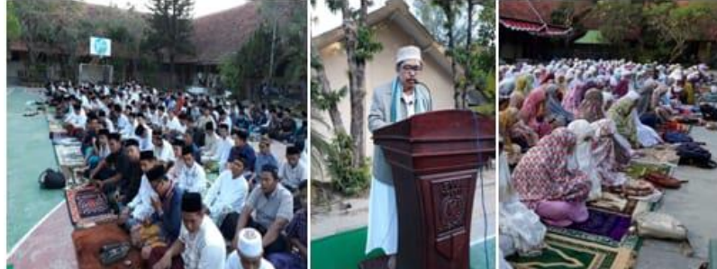
Gambar 4.10 Foto Pelaksanaan Shalat Idul Fitri 1442 Hijriah di Lapangan Sekolah

sebagai ibadah untuk mendekatkan diri kepada Allah SWT dan bentuk ketaatan sebagai hamba Allah.