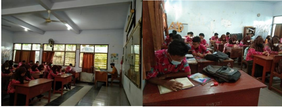
Gambar 4.7 Foto Peserta Didik Melaksanakan Tadarus di Pagi Hari

Setelah memberikan keteladanan yang baik perlu juga diterapkan pembiasaan agar segala sesuatunya benar-benar tertanam di dalam diri peserta didik. Dan untuk membentuknya tidak berhenti hanya sampai pada pemberian keteladanan saja, namun perlu dibiasakan secara terus-menerus kapan dan dimana saja. Dalam membentuk budaya religius peserta didik, hal-hal yang dibiasakan adalah pembiasaan berperilaku terpuji yang sesuai dengan agama dan kepercayaan yang dianutnya, serta melaksanakan kegiatan tadarus di pagi hari sebelum melakukan proses belajar mengajar dimulai.