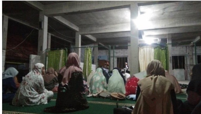
Gambar 4.9 Foto Pelaksanaan Pengajian Rutin di Masjid

ini diawali dengan shalat Maghrib berjamaah, lalu membaca surat Yasin, dilanjutkan dzikir bersama, dan yang terakhir mendengarkan ceramah sambil lalu menunggu waktu shalat isyak. Kegiatan ini diikuti oleh peserta didik dan guru-guru. 48