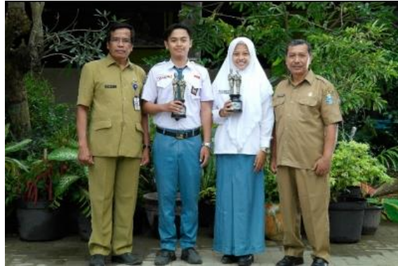
Gambar 4.5 Foto Guru dan Peserta Didik Berpakaian Rapi, Sopan, dan Santun

bersikap, menaati aturan yang berlaku di sekolah, dan melaksanakan shalat berjamaah. 24