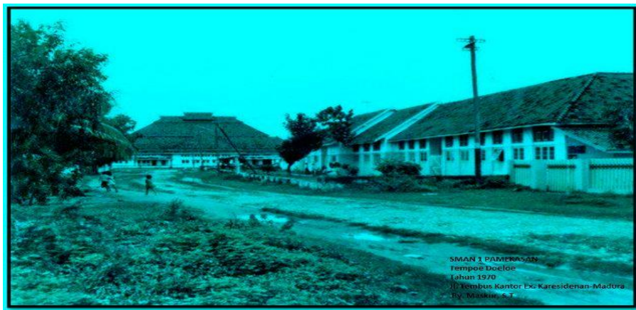
Gambar 4.1 Foto Pertama SMAN 1 Pamekasan

SMAN 1 Pamekasan dibentuk pada tahun 1948. Proses belajar mengajar diselenggarakan di Gedung Eks. Karesidenan Madura. Sekolah ini terletak di pusat kota Pamekasan yang saat itu beralamat di Jl. Slamet Riyadi No.1 Pamekasan atau di sebelah utara Monumen Arek Lancor (kini). Dan merupakan satu-satunya SMA di Madura saat itu, karena pada saat itu yang ada hanya 1 (satu) SMA yaitu SMAN 1 Pamekasan. Sekolah ini telah melahirkan banyak tokoh diantaranya Jenderal R. Hartono (Mantan KSAD dan Mantan Menteri Penerangan saat Presiden Soeharto).