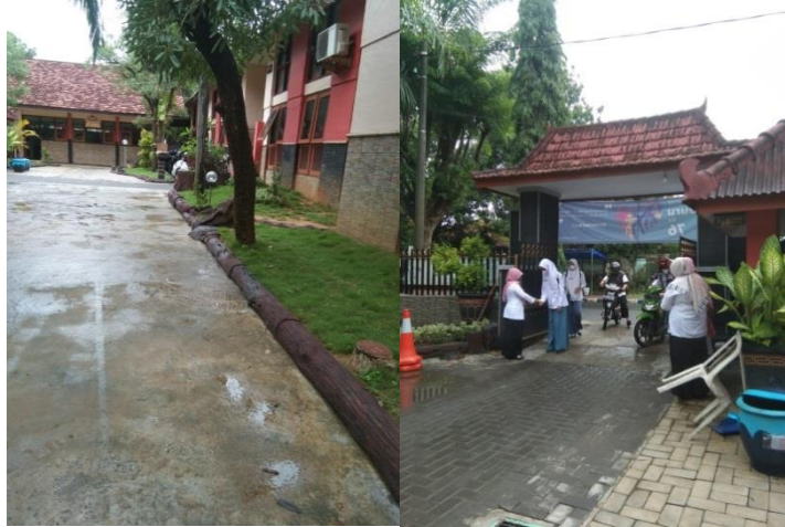
Gambar 4.12 Foto Peserta Didik dengan Tertib dan Disiplin Masuk ke Sekolah dan Lingkungan yang Bersih

Budaya hidup bersih, tertib, dan disiplin benar-benar diterapkan di SMAN 1 Pamekasan. Tujuannya ialah melatih para peserta didik untuk lebih menghargai waktu, menghargai aturan sekolah, dan tentunya juga menghargai orang lain. Ketika kita sudah mampu menghargai ketiganya tentunya kita tidak akan merugikan orang lain maupun diri kita sendiri, dan hal tersebut juga akan bermanfaat untuk diri kita sendiri.