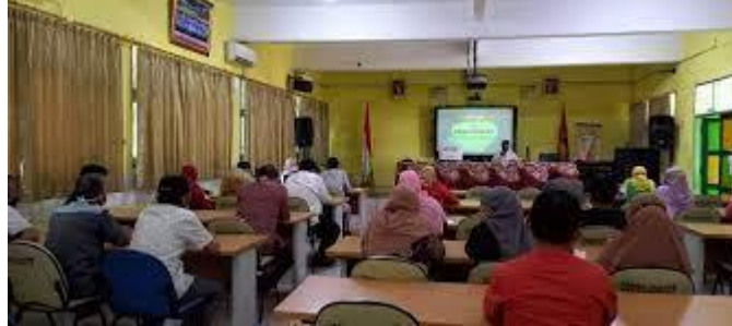
Gambar 4.3 Pelaksanaan Rapat di SMAN 1 Pamekasan

membentuk budaya religius peserta didik agar segala perencanaan yang matang dapat tersusun dengan sistematis dan terarah dengan baik. 11