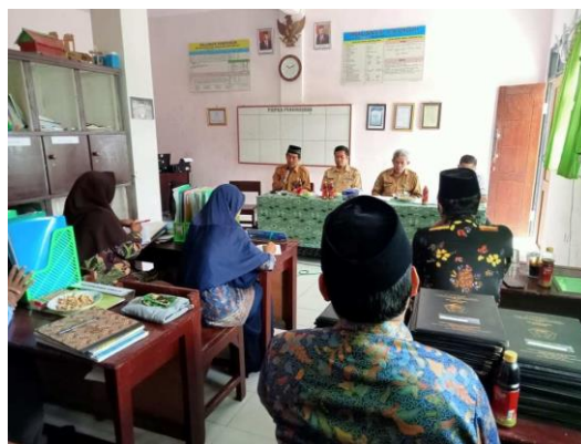
Gambar 4.9 Rapat evaluasi

Hasil pengamatan tersebut dibuktikan dengan gambar dokumentasi berikut: