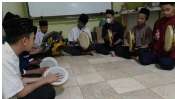
Gambar 4.8 Latihan ekstrakurikuler hadrah

Hasil pengamatan tersebut dibuktikan dengan gambar dokumentasi berikut: