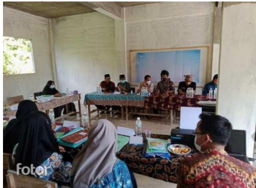
Gambar 4.10 Rapat evaluasi

Hasil pengamatan tersebut dibuktikan dengan gambar dokumentasi berikut: