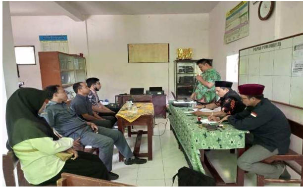
Gambar 4.3 Rapat perencanaan di SMKS Nurul Ulum Mangar Tlanakan

Berdasarkan hasil dokumentasi diatas sudah membuktikan bahwasannya SMKS Nurul Ulum Mangar Tlanakan sudah melakukan perencanaan dengan sangat baik, dengan dilakukannya sebuah rapat untuk membahas perencanaan kegiatan ekstrakurikuler dengan semua pihak pendidik termasuk dengan membahas perencanaan ekstrakurikuler hadrah.