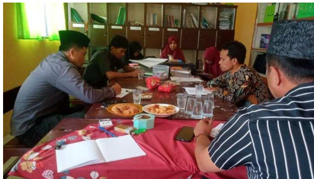
Gambar 4.4 Rapat perencanaan di SMKS Nurus Salafiah Sejati Camplong

Hasil pengamatan tersebut dibuktikan dengan adanya gambar dokumentasi sebagai berikut: