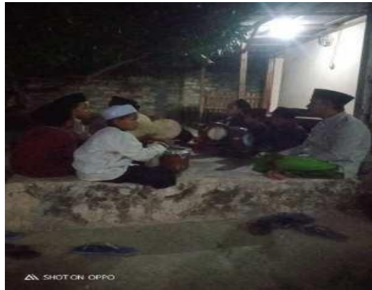
Gambar 4.7 Latihan ekstrakurikuler hadrah

Hasil pengamatan tersebut dibuktikan dengan gambar dokumentasi berikut: