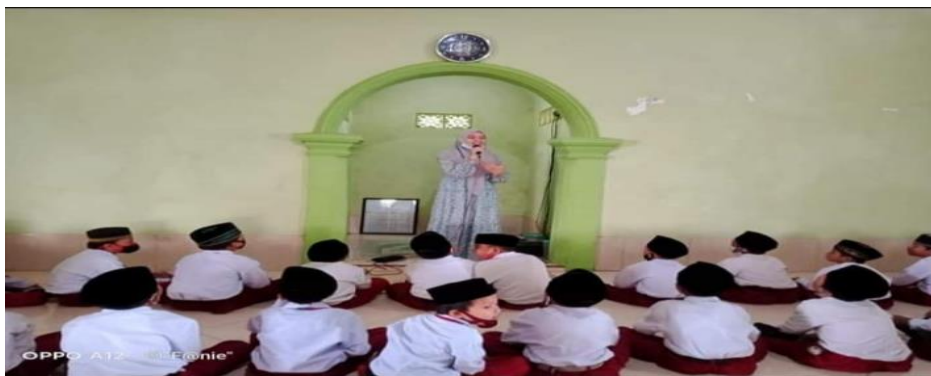
Gambar 4.10 Morning Spirit 65

Rutinitas islami selanjutnya adalah mengaji. Pada pagi hari siswa dibiasakan untuk mengaji terlebih dahulu, diwajibkan bagi setiap siswa baik kelas 1-6 kepada para ustadz/ustadzahnya. Menurut ustd. Juhartatik ini dinamakan ngaji bin nadzar: