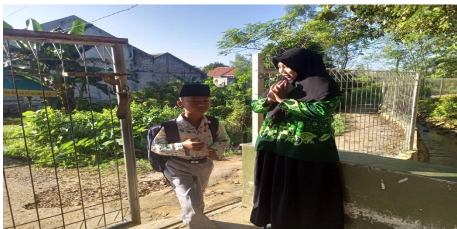
Gambar 4.8 Penyambutan Siswa 52

penerapan full day school yang ada di sekolah SDI Nurul Bayan Kebonagung yaitu setiap pagi dimulai dengan penyambutan siswa di depan pintu gerbang, para guru piket berbaris sambil menunggu siswa yang datang lalu para siswa datang bergiliran untuk bersalaman, sambil menyapa menggunakan sapaan ringan “assalamu’alaikum, pagi ustadz/ustadzah” dengan penuh senyuman dan semangat memulai kegiatan di sekolah. 51