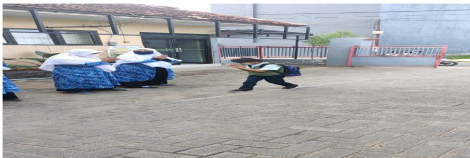
Gambar 4.15 Penyambutan Siswa 117

Pembiasaan selanjutnya adalah kegiatan sholat berjama'ah. Kegiatan ini dikerjakan sebelum pembelajaran dimulai. Dengan maksud agar siswa memulai pembelajaran dengan semangat dan penuh kebahagiaan. Pelaksana dari sholat dhuha ini adalah para siswa khususnya dan sebagian guru. Ustd. Lin menyampaikan: