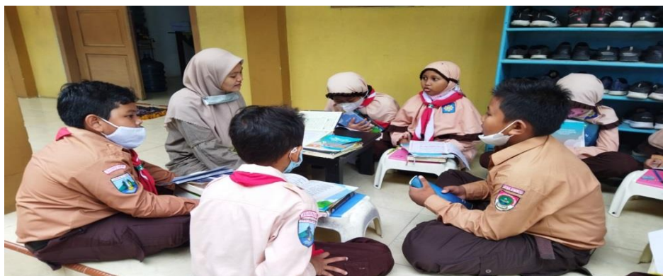
Gambar 4.18 Pembelajaran Al-Qur’an 147

Berdasarkan pengamatan peneliti, pada jam 10.20 menunjukkan bel masuk berbunyi. Setelah istirahat selesai anak-anak masuk kelas dengan pembelajaran Al-Qur’an. Dimana para siswa berbentuk kelompok dengan berlingkar dan ada satu guru setiap kelompoknya. Anak-anak membaca Al-Qur’an dan menghafal atau menyetor hafalan pada gurunya dengan ada tahsin didalamnya. 146