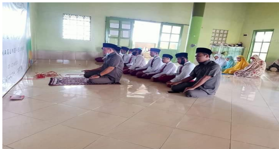
Gambar 4.13 Pendampingan Sholat 97

Pendampingan dibutuhkan dalam program ini, contohnya dalam sholat ada jadwal untuk mendampingi sebagai imam ataupun makmum sholat yang dikerjakan.