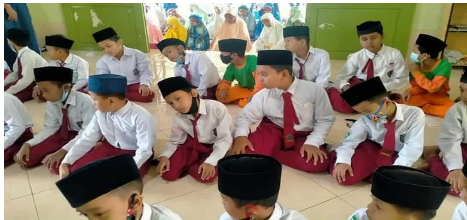
Gambar 4.9 Sholat Berjama'ah 59

untuk kelas 1-3 sholat dhuha di kelas bersama wali kelas masing-masing. 58