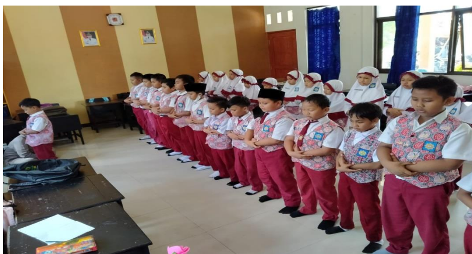
Gambar 4.16 Sholat Berjama'ah Di Kelas 122

Jadi sholat dhuha pernah dilaksanakan di sekolah ketika sebelum pandemik, tapi ketika pandemi ada pemangkasan jam pelajaran jadi sholat dhuha di rumah masing-masing.