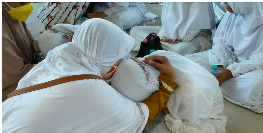
Gambar 4.21 Deklarasi Kejujuran 167

Berdasarkan observasi yang dilakukan pada hari senin tanggal 16 mei 2022 sekitar pukul 10.00, diadakan deklarasi atau pengambilan janji siswa untuk berlaku jujur dalam ujian yang akan diikutinya. Deklarasi ini dilakukan di sekolah tepatnya di masjid yang disaksikan orangtua dan guru. Siswa membacakan janji bahwa mereka akan jujur dalam mengerjakan ujian. Dengan diakhiri berpelukan bersama orangtua masing-masing niat untuk meminta restu mereka. 166