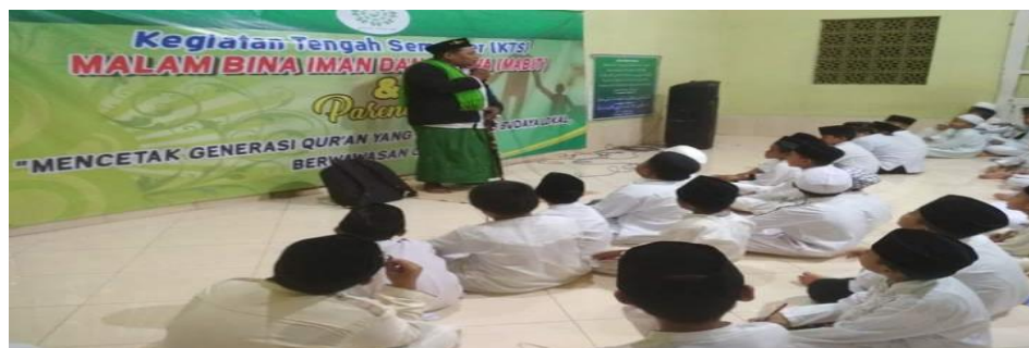
Gambar 4.12 Mabit 86

untuk menjadikan siswa lebih paham dan kuat dalam hal ibadah sehingga tidak hanya terbiasa di sekolah tetapi juga di rumah. 85