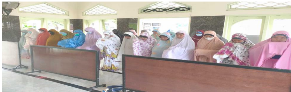
Gambar 4.17 Sholat Dhuhur Berjam'ah 128

kelas 1-3 siswa sholat dhuhur di kelas dengan wali kelas masing-masing. 127