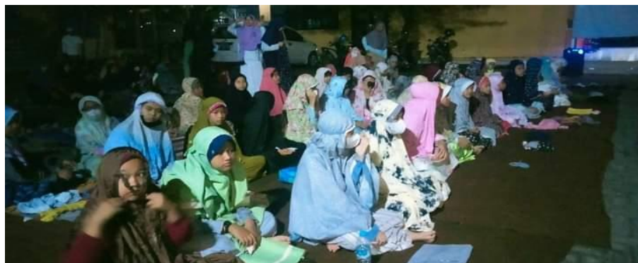
Gambar 4.20 Mabit 158

Setiap bulan di sekolah ini juga mengadakan program puasa sunnah. Ust. Amirullah memberi tahu di SDIT Al-Hidayah mengadakan program bulanan yaitu berpuasa. Adapun pemaparannya sebagai berikut: