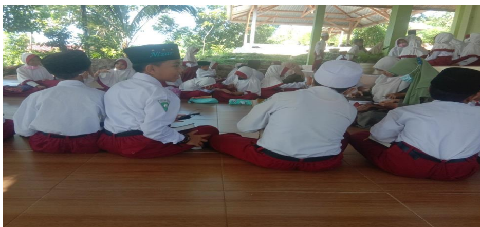
Gambar 4.11 Ngaji Bin Nadzar 70

Dimana setiap pagi sebelum pelaksanaan tahfidz, para siswa dibentuk kelompok dengan dipandu oleh dua guru untuk melaksanakan ngaji bin nadzar yang mana ngaji seperti biasa dengan dikoreksi pengampunya. 69