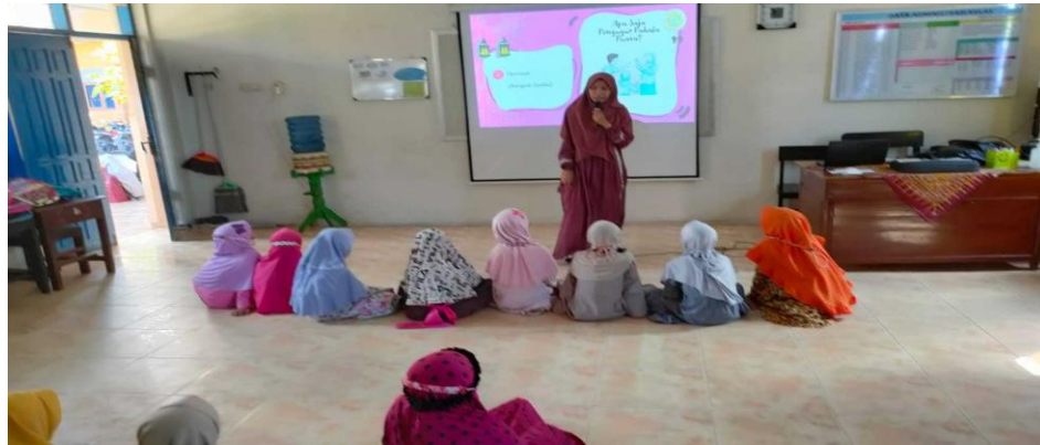
Gambar 4.19 Kajian Keputrian 153

antusias mengikuti kegiatan tersebut, pembahasan dalam kajian ini adalah tentang puasa. 152