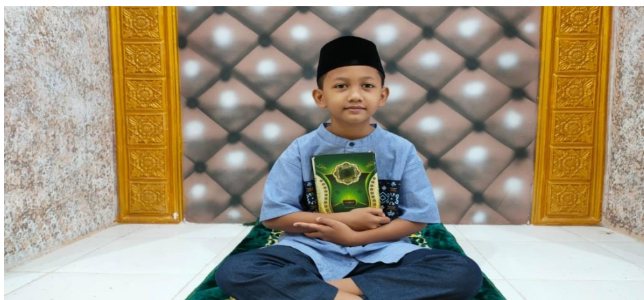
Gambar 4.15 Muraja'ah Di Rumah 206

Mendisiplinkan siswa banyak cara diantaranya dengan menghargai waktu ketika sampai sekolah, sholat, Al-Qur'an dan lainnya. Dimana hal tersebut diberlakukan di sekolah dan di rumah.