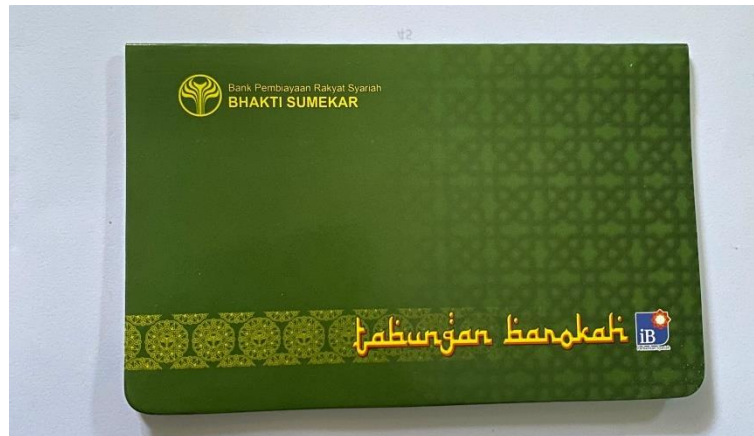
Buku Tabungan Produk Tabungan Barokah