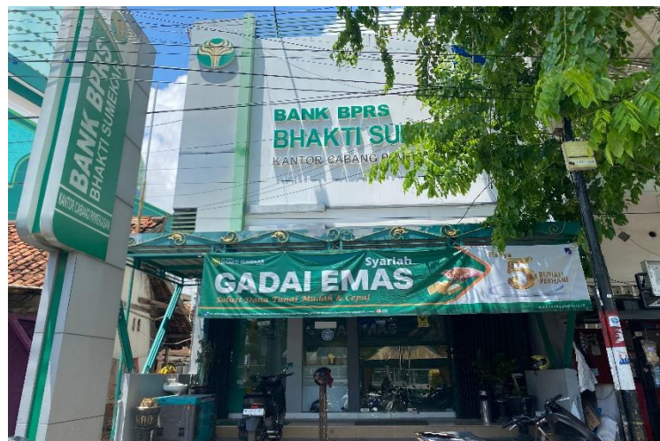
Foto Kantor BPRS Bhakti Sumekar Kantor Cabang Pamekasan