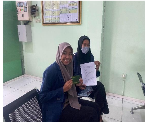
Penyebaran sekaligus Pengisian Kuesioner kepada Nasabah